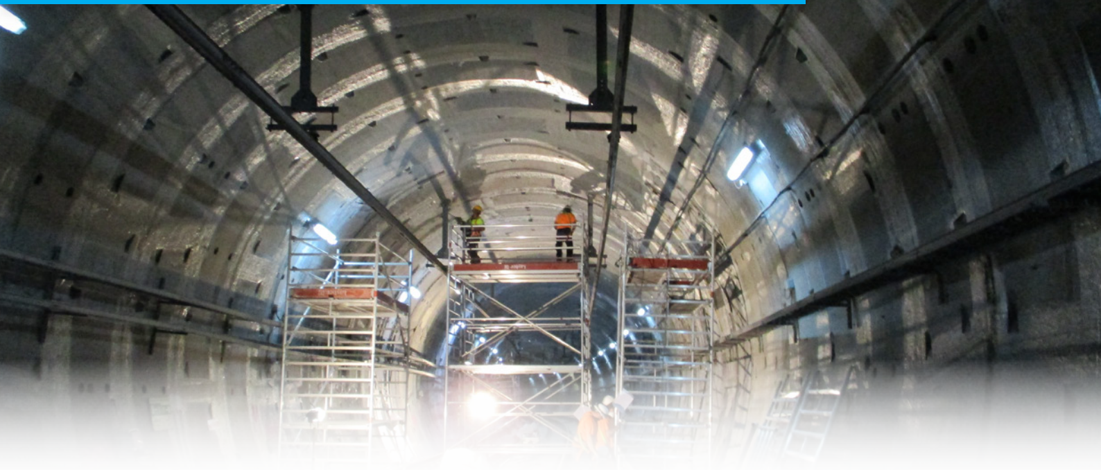
Túnel de metro línea 7B Metro de Madrid:

ROVER realizó el estudio y diseño de una metodología de aplicación basada en el desarrollo de nuevas resinas bi-componente, capaz de poner solución al elevado número de filtraciones de agua aparecidas en las juntas de las dovelas, que fueron validadas en la puesta en obra del tramo de túnel de Metro Madrid que une las paradas de Barrio del Puerto con Hospital de Henares.